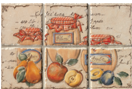
11CF Mira 10 Frutta C/6 10x10 - 4"x4"