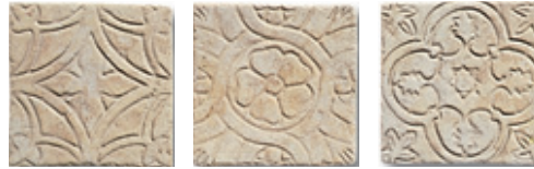
12SF Vigonza 10 Formelle Mix 10x10 - 4"x4"