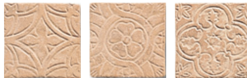
14SF Noale 10 Formelle Mix 10x10 - 4"x4"