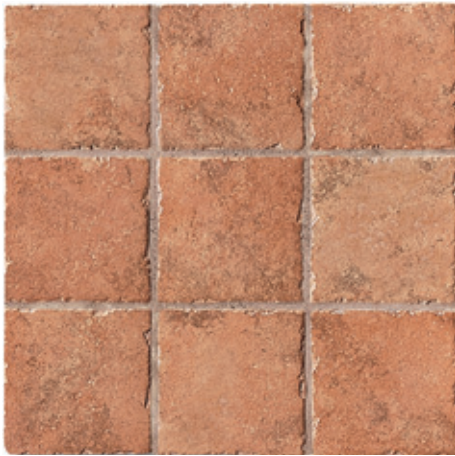
AC75 Bassano 10 10x10 - 4"x4"