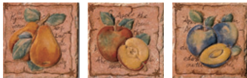
1BF3 Bassano 10 Frutta Mix 10x10 - 4"x4"