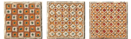
1BP4 Noale 10 Patch Mix 10x10 - 4"x4"