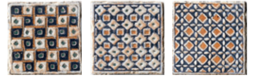
1BP2 Vigonza 10 Patch Mix 10x10 - 4"x4"