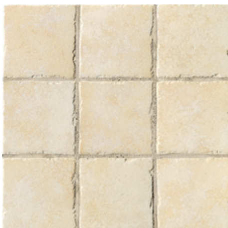
AC73 Mira 10 10x10 - 4"x4"