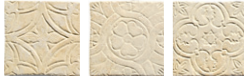
11SF Mira 10 Formelle Mix 10x10 - 4"x4"