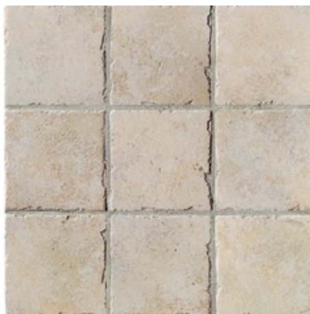
AC74 Vigonza 10 10x10 - 4"x4"