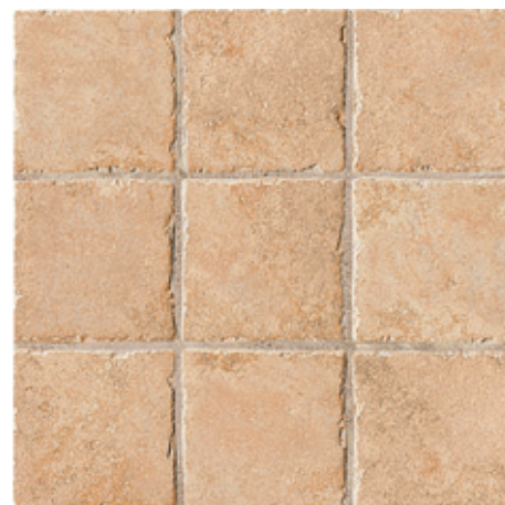
AC76 Noale 10 10x10 - 4"x4"