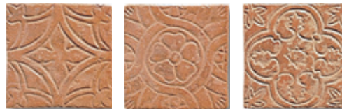
13SF Bassano 10 Formelle Mix 10x10 - 4"x4"