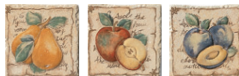
1BF4 Noale 10 Frutta Mix 10x10 - 4"x4"

Pavimenti consigliati / Recommended floor tiles