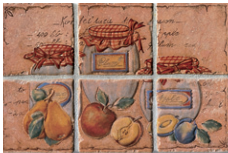
13CF Bassano 10 Frutta C/6 10x10 - 4"x4"