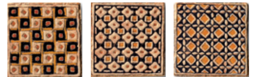
1BP3 Bassano 10 Patch Mix 10x10 - 4"x4"