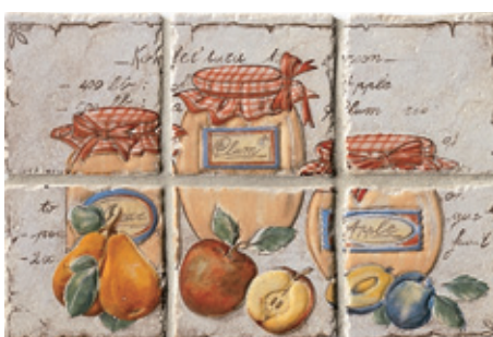
12CF Vigonza 10 Frutta C/6 10x10 - 4"x4"