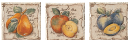
1BF1 Mira 10 Frutta Mix 10x10 - 4"x4"