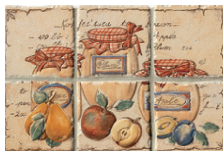
14CF Noale 10 Frutta C/6 10x10 - 4"x4"