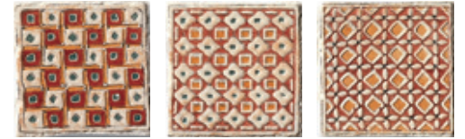
1BP1 Mira 10 Patch Mix 10x10 - 4"x4"