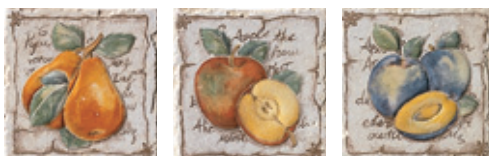
1BF2 Vigonza 10 Frutta Mix 10x10 - 4"x4"